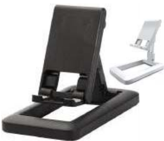
5.5" X 2.75"

SOSTENEDOR PARA CELULAR O TABLET, EXPANDIBLE, VARIOS ANGULOS, PLASTICO.