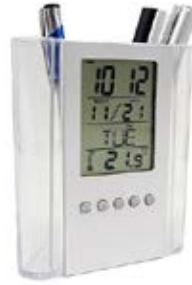
4" X 4.5"

PORTA PLUMA CON RELOJ DIGITAL DE PARA ESCRITORIO. VASO PORTA PLUMA TRANSPARENTE.