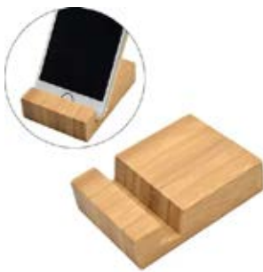
2.75" X 3.25"

SOSTENEDOR PARA CELULAR EN MADERA NATURAL