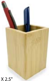
3.5" X 2.5"

PORTA PLUMA PARA ESCRITORIO, RECTANGULAR, EN BAMBOO NATURAL.