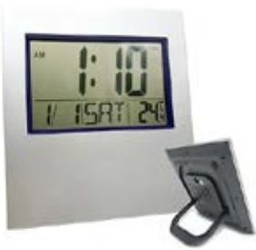
6.75" X 7.5"

RELOJ DIGITAL PARA ESCRITORIO O PARED. CON HORA, FECHA, TEMPERATURA. COLOR PLATEADO. MATERIAL PLASTICO.